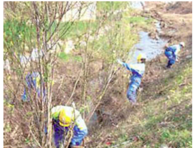
Dagli argini alla messa in sicurezza per il Ponterosso

tecnici sono già in fase avanzata per la progettazione preliminare del secondo lotto e la firma dell'accordo con la Regione Toscana per il tratto compreso fra il cantiere comunale e il ponte Stecco che prevede un investimento di 2.666.000 euro, mentre lo stralcio successivo riguarda il collegamento fra il torrente Ponterosso e il borro della Granchie.